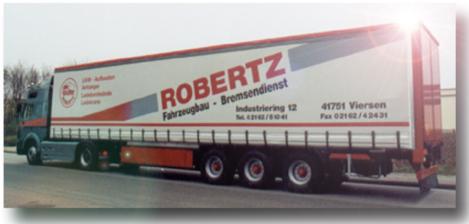
Peter Robertz + Sohn GmbH

Wir danken außerdem unseren Sponsoren für die freundliche finanzielle Unterstützung: